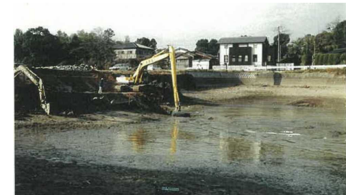
<ため池の浚渫工事>