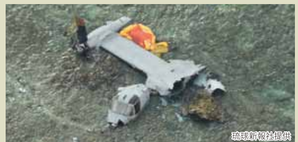
平成28年12月に名護市の集落近くに墜落したオスプレイ。墜落現場は、辺野古新基地が造られようとしている場所からも数kmの距離だった。