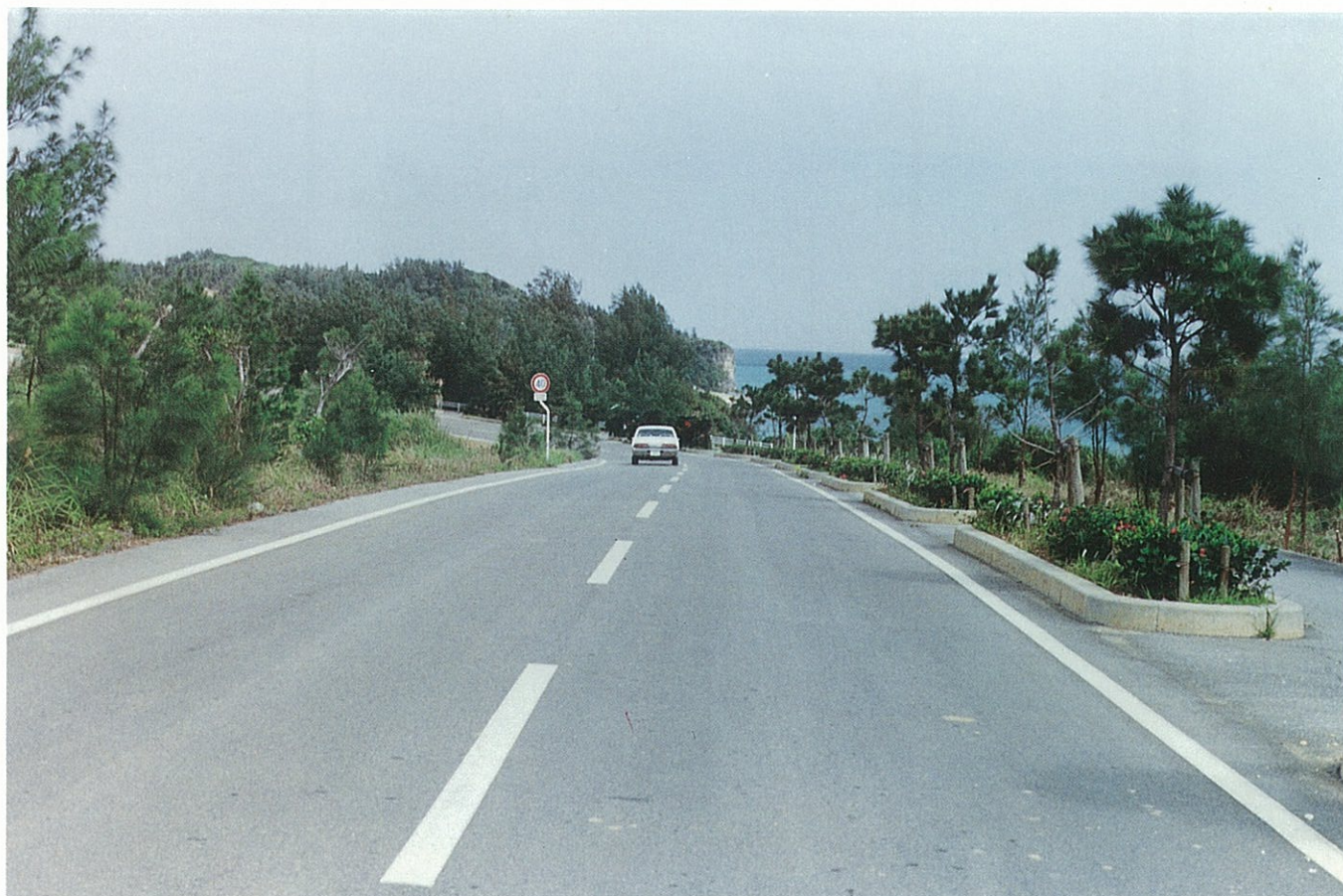
美しい自然景観と道路が調和しており観光関連道路として期待されている。