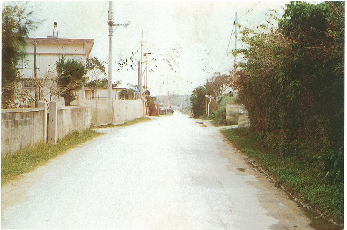
恩納村喜瀬武原付近