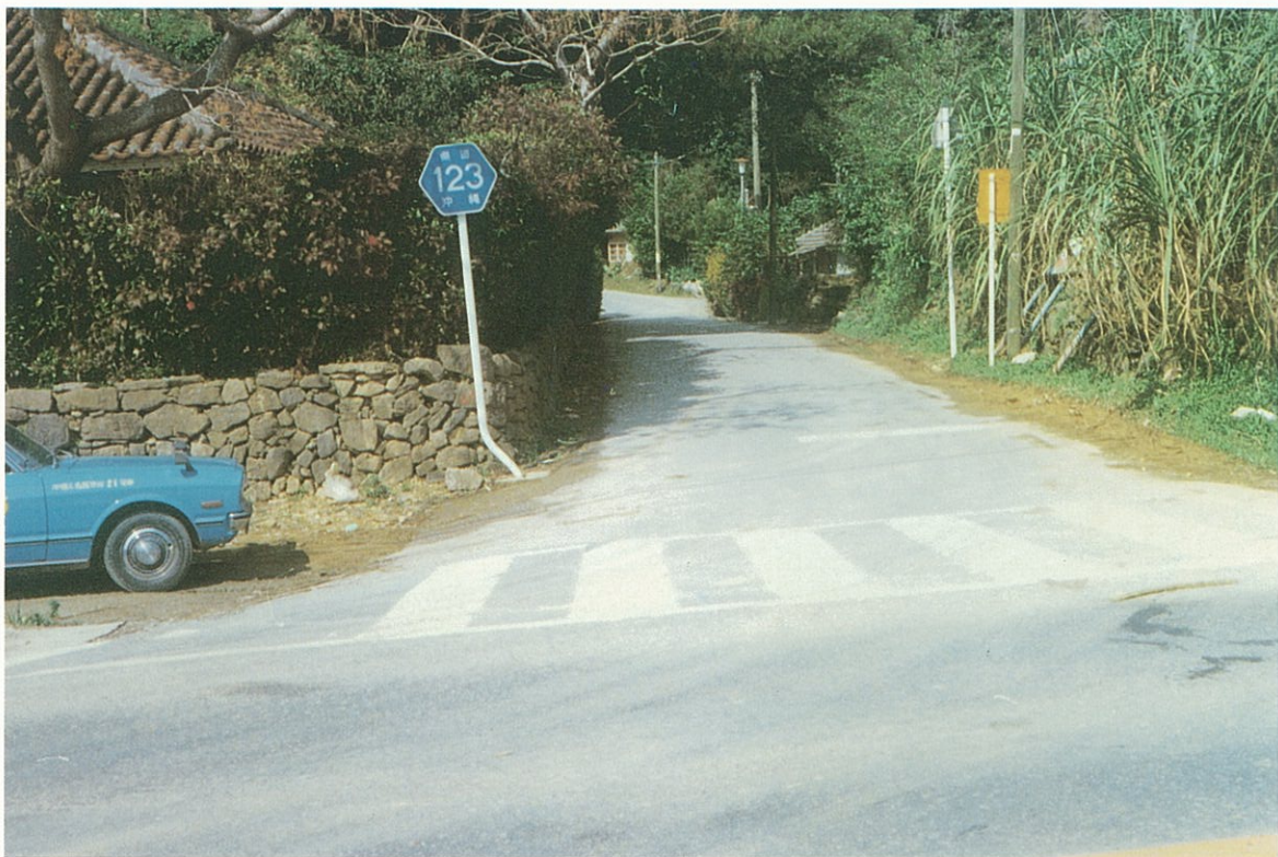
今帰仁村湧川付近