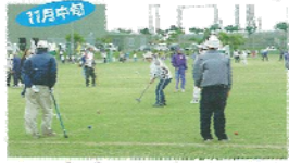
11月中旬 サントピアグラウンドゴルフ宮古島大会 いまやグラウンドゴルフのメッカとなった宮古島を舞台に、国内外から多勢の愛好者が参加するビッグイベント。