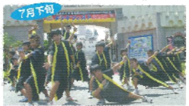
7月下旬 ダンクフェスト 宮古島の特色ある祭典イベントを行う物産市や、ドイツの賑やかな祭典と合わせて、ミニ池田池などの観覧船が楽しめる。