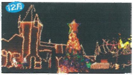
12月 ラスのドイウ文化村イルミネーションフェスト ドイウ村の中心を20万本の電球で飾り付け、幻想的にライトアップ。クリスマスや大晦日(12月31日)に多くの人々が訪れる。