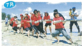
7月 サニツ浜カーニバル 与那国島のサニツ浜で大勢の千瀬崎に、競馬、モトクロス、餅引き、ビーチバレー、相撲大会などが行われる。