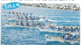
6月上旬 ハーリー(海人祭) 一年一度の大祭。無事・安全を祈願に新祭典が行われ、肥前の6月4日に島内各地で開催されるハーリーレースなどを行う。