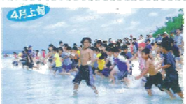
4月上旬 海びらき 夏を告げる海びらきは毎年4月の第一日曜日(下地の前夜)にビーチで開催。縁起が、宝探しなどメニューがいろいろ。