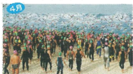
4月 全日本トライアスロン宮古島大会 国内外のトップアスリートをはじめ大会が参加する世界大会。スイム3km、バイク100km、ラン210kmの強豪対決レース。