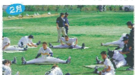
2月 フロ野原オリックスパファローズキャンプ 1990年からスタート。プロのプレーや人気の選手を身近で見られるため、地元はもちろん島外からも多勢の人々が訪れる。