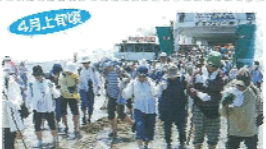
4月上旬 八重千瀬まつり 大勢の千瀬崎に上陸する大規模な祭典“八重千瀬”を、肥前の3月3日に船を舟にして見物する。島内外から大勢の人が訪れる。