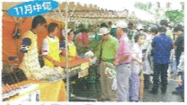
11月中旬 宮古の産物まつり 宮古島内のあらゆる産物の物産品を一堂に集め展示・販売する催し。茶食・試飲のコーナーもあり大勢の人でにぎわう。