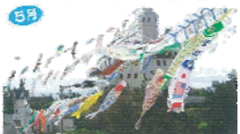
5月 ラスのドイウ文化村の祭りフェスト 4月下旬から6月中旬にかけて一帯の田舎の風景が映える。祭りやイベントが盛りだくさん。手作りのお祭りでは日本一の規模。