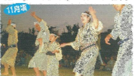
11月 クイチャーフェスティバル 島民が心なりの人達が思いの節を駆けつけ、伝統的な祭典に参画する。毎年1月第一日開催。