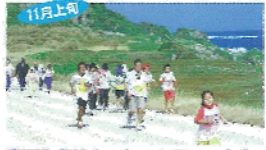
11月上旬 東平女名崎タートルマラソン大会 東平女名崎をゴールに各々が自分のペースでゆっくり走るユニークなマラソン大会。25km、50km、75km、2kmの各クラスがある。