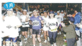
1月 宮古島100kmサイドマンレース 宮古島全体を舞台に100キロという長丁場を走り抜く陸上レース。大勢の参加者が日頃から鍛えた脚力を競い合う。