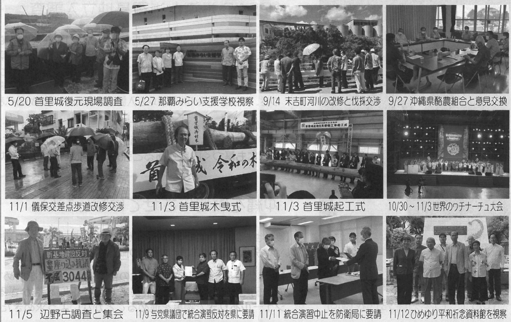
5/20 首里城復元現場調査 5/27 那覇みらい支援学校視察 9/14 末吉町河川の改修と伐採交渉 9/27 沖縄県酪農組合と意見交換 11/1 儀保交差点歩道改修交渉 11/3 首里城木曳式 11/3 首里城起工式 10/30~11/3 世界のワチナーユメ会 11/5 辺野古調査と集会 11/9 与県議団で統合演習反対を県に要請 11/11 統合演習中止を防衛局に要請 11/12 ひめゆり平和記念資料館を視察

77年前の沖縄戦では、本土防衛の捨て石にされ、県民4人に1人を占む20万人余の貴重な命が奪われた。沖縄戦が終わっても沖縄は日本から切り離され、27年間も米軍の軍事占領支配下に置かれてきた。復帰後50年たった今なお、国土面