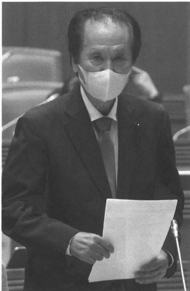
10/11 日本共産党代表質問