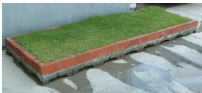
降雨後の透水状況