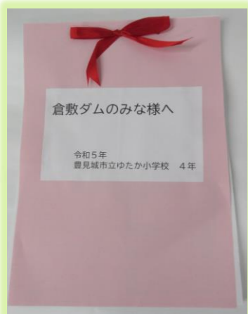
ゆたか小学校4年生

社会見学を訪れた「ゆたか小学校4年生・仲西小学校4年生・糸満小学校4年生」の皆さんから、お手紙を頂きました♪