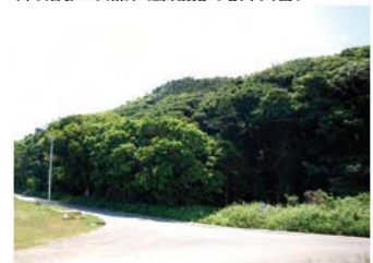
Ⓓ 字西の御願の植物群落 (県指定・天然記念物/昭和55年4月30日)