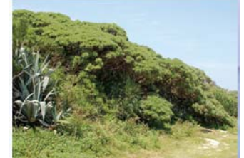
Ⓕ 照喜名原のモンバの木群落 (村指定・天然記念物/昭和59年9月14日)