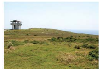
Ⓐ 番屋原の広場景勝地 (村指定・名勝/昭和59年9月14日)