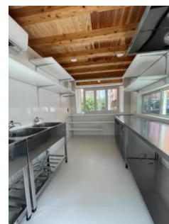
パンケーキ店内観