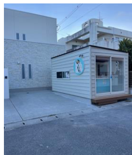
パンケーキ店外観