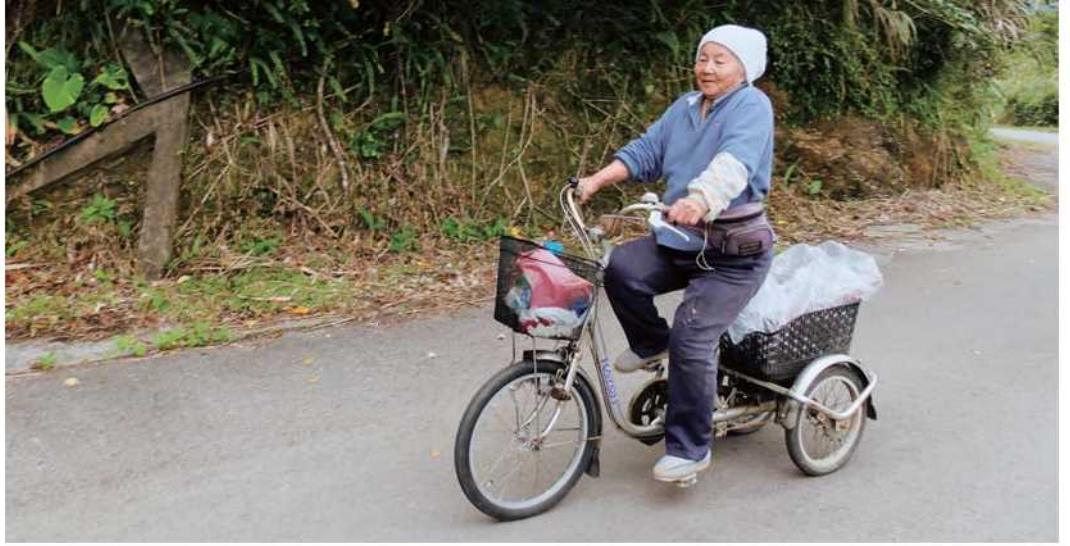
畑への2キロほどの道を自転車で