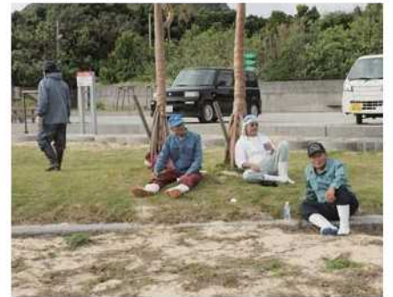
一息ついて仲間とゆんたく (海岸・海浜清掃業務)