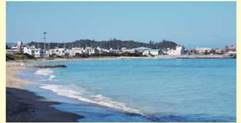
国頭村（伊地付近から辺土名方向を望む）