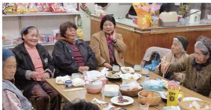
辺野喜共同店でゆんたく(左から2人目)