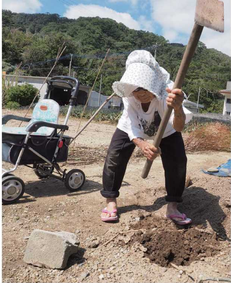
自宅近くの畑。野菜やイモ類を育てる。