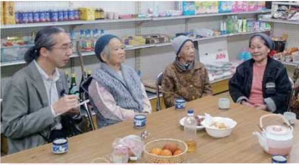
国頭村辺野喜区の共同店で高齢者の話を聞く、 生活支援コーディネーター試行的派遣業務の担当者(左端)