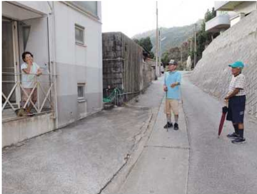
歩きながらひとり暮らし高齢者に声掛け