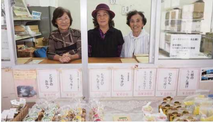
フェリーターミナル内の店舗