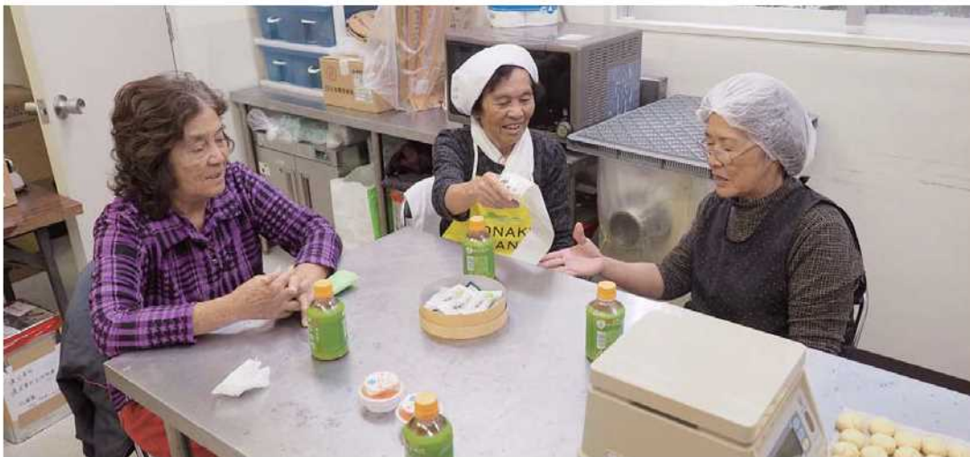
ちんすこう製造の休憩時間に仲間とゆんたく