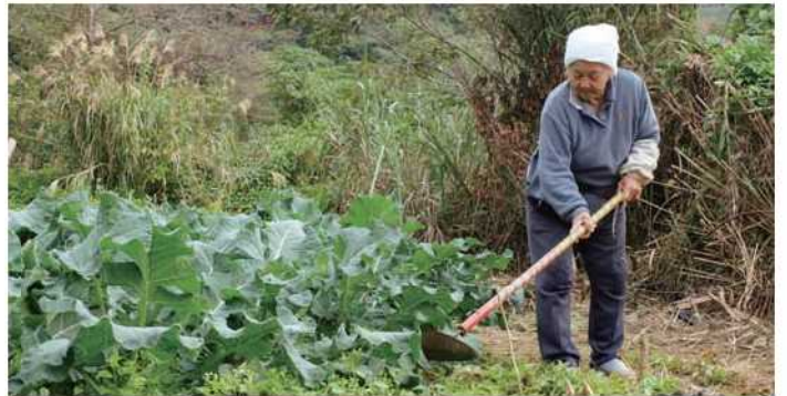
ほとんど毎日畑仕事