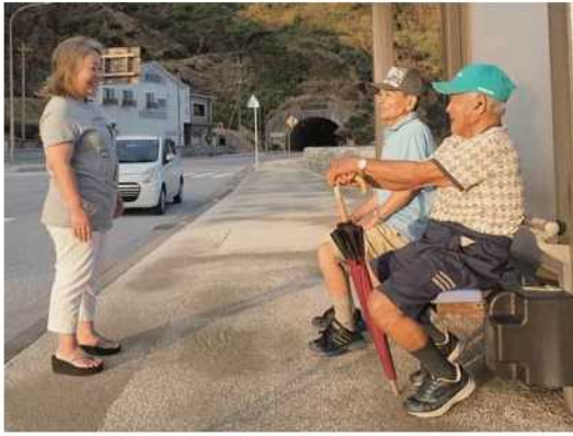
バス停でのゆんたく。通り掛かりの人もしばしば加わる