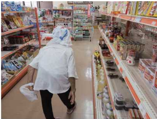
安波共同店で買いもの