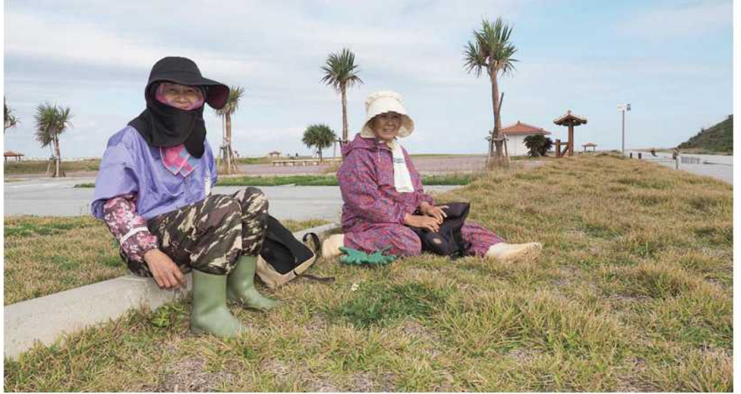
休憩時間にゆんたく(環境保全・美化推進事業)