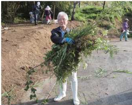
70歳代の人たちが活躍 (環境保全・美化推進事業)