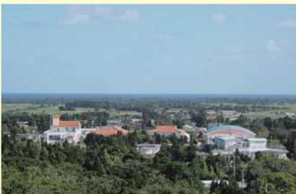
八重山遠見展望台からの眺望

沖縄本島から南西約350km、宮古島と石垣島のほぼ中間にあり、多良間島と水納島の2島からなる。主島の多良間島は周囲約26km。集落はほぼ1か所にまとまり8地区で構成。小、中学校は各1校。集落外にはサトウキビ畑が広がる。旧暦8月8日の伝統行事「八月踊り」は、国の重要無形民俗文化財。人口1112人、523世帯、高齢化率29.0%（同）