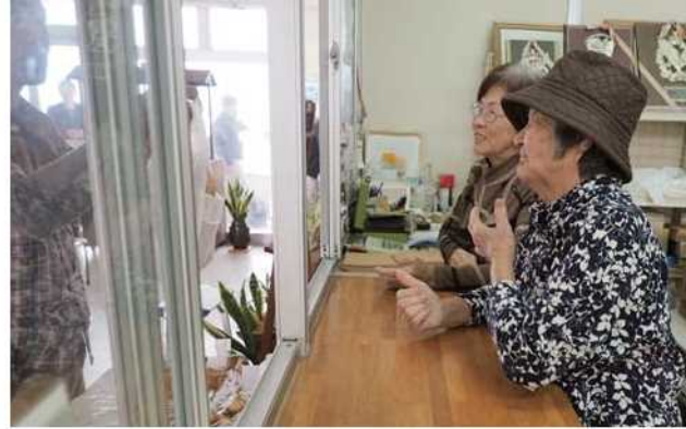
接客対応もいきいきと