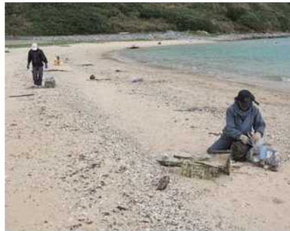
小さな漂着物も丹念に拾う (海岸・海浜清掃業務)