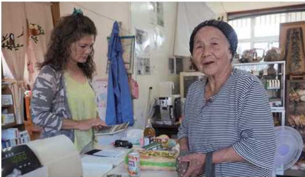
与那共同店で買いもの