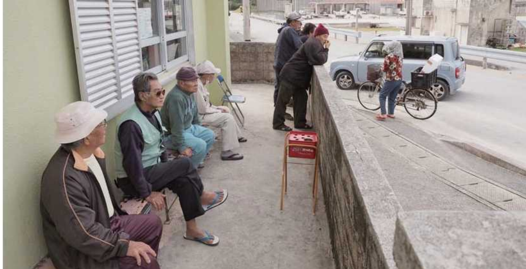
漁協脇の「男の居場所」。港を眺めながらゆんたく