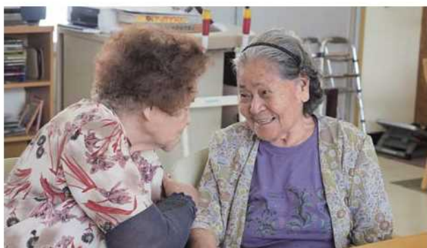
デイサービスでもゆんたく(右)