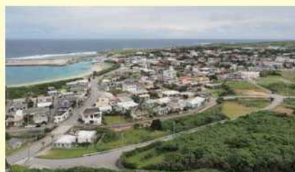
「ティンダバナ」から祖納集落を望む

沖縄本島から南西約509kmの与那国島（周囲約27km）一島で町を構成。日本最西端に位置する。町域は祖納、久部良、比川の3集落に分かれ、小学校区もこの3つ。中学校は祖納、西久部良の2つ。近年、島特産の長命草（ホタンボウフウ）を原料に多様な健康食品が開発され、話題を呼んでいる。人口1716人、950世帯、高齢化率21.0%（同）