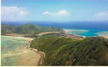
西森園地展望台からの眺望

沖縄本島から北西約60kmに位置。渡名喜島と入砂島の2島で構成し、主島の渡名喜島は周囲約12.5km、面積約387ヘクタール。県内で最も面積・人口規模が小さい。集落は1か所にまとまり、西、東、南の3地区に大別される。伝統的な赤瓦屋根の家屋が多く残り、島全体が国の重要伝統的建造物群保存地区に選定。人口378人、世帯数220世帯、高齢化率42.7%（同）