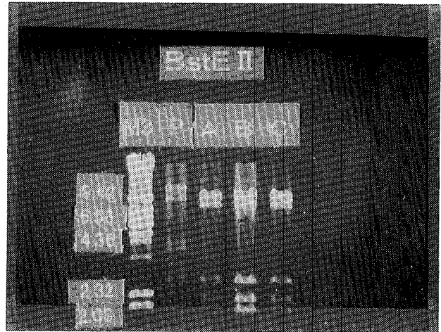
M3 : マーカー P : 感染研分与株 A : Ad7/223/97. 沖縄 B : Ad7/226/97. 沖縄 C : Ad7/227/97. 沖縄