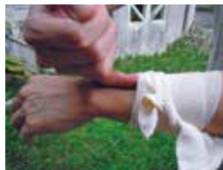
松弛地缠绕伤口，留下可供一根手指穿过的空隙。

请用绷带或领带等宽型布条轻轻缠绕在较为靠近心脏的伤口一侧的位置，以减少血液流动。每隔15分钟松开一次。 切勿用细绳等紧勒住伤口。 如果因恐惧心理而紧紧勒住伤口恐会导致血流停止，适得其反。