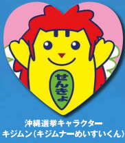
沖縄選挙キャラクター キジムン(キジムンめいすいくん)