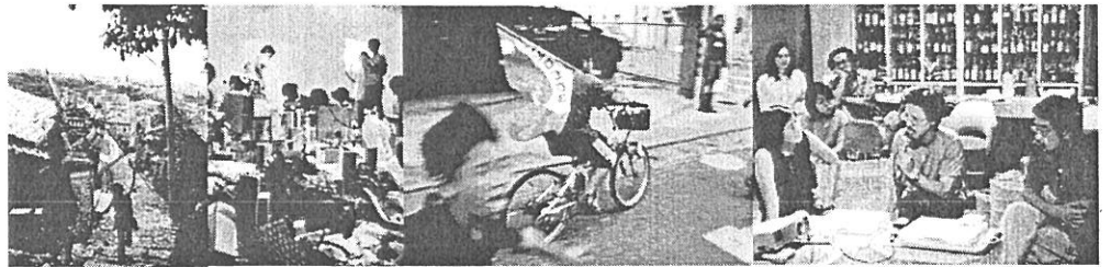
wanakioトランスアカデミーの様子