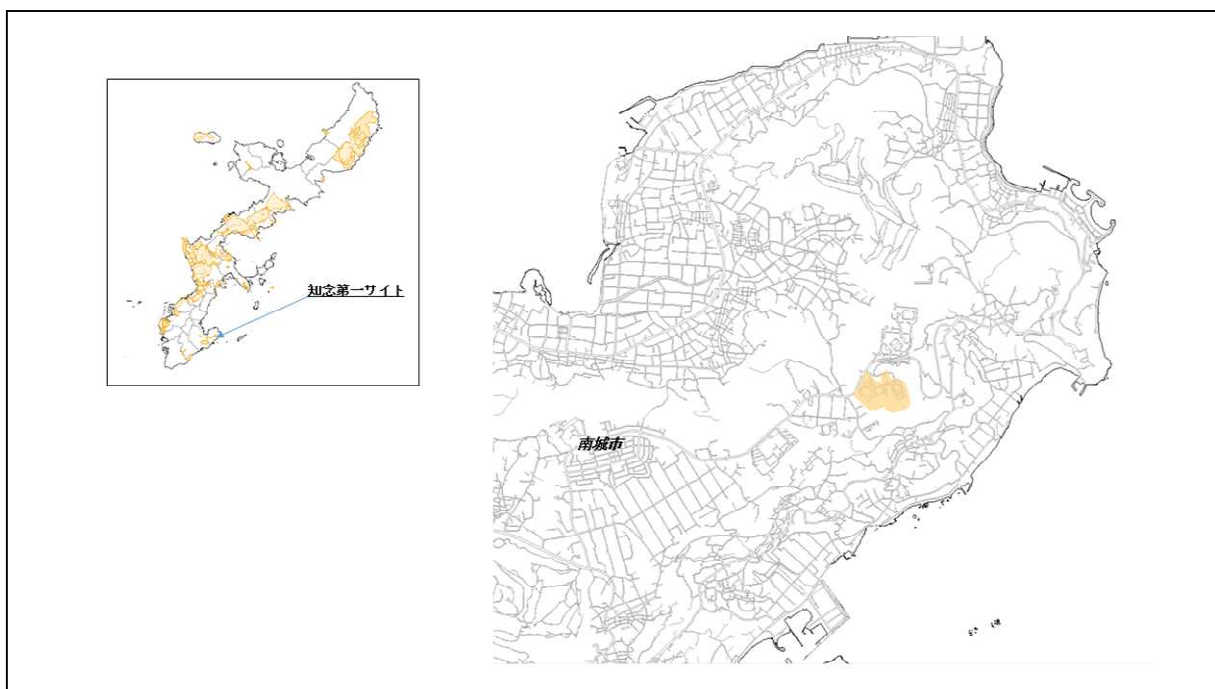
図 66-1 知念第一サイトの位置図（昭和47年時）

( http://www.mofa.go.jp/mofaj/area/usa/sfa/kyoutei/pdfs/02_03.pdf ) を参照