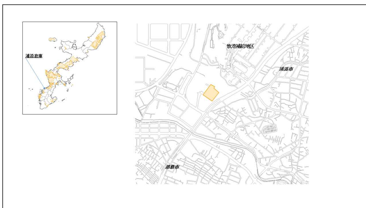
図 57-1 浦添倉庫の位置図（昭和47年時）

( http://www.mofa.go.jp/mofaj/area/usa/sfa/kyoutei/pdfs/02_03.pdf ) を参照