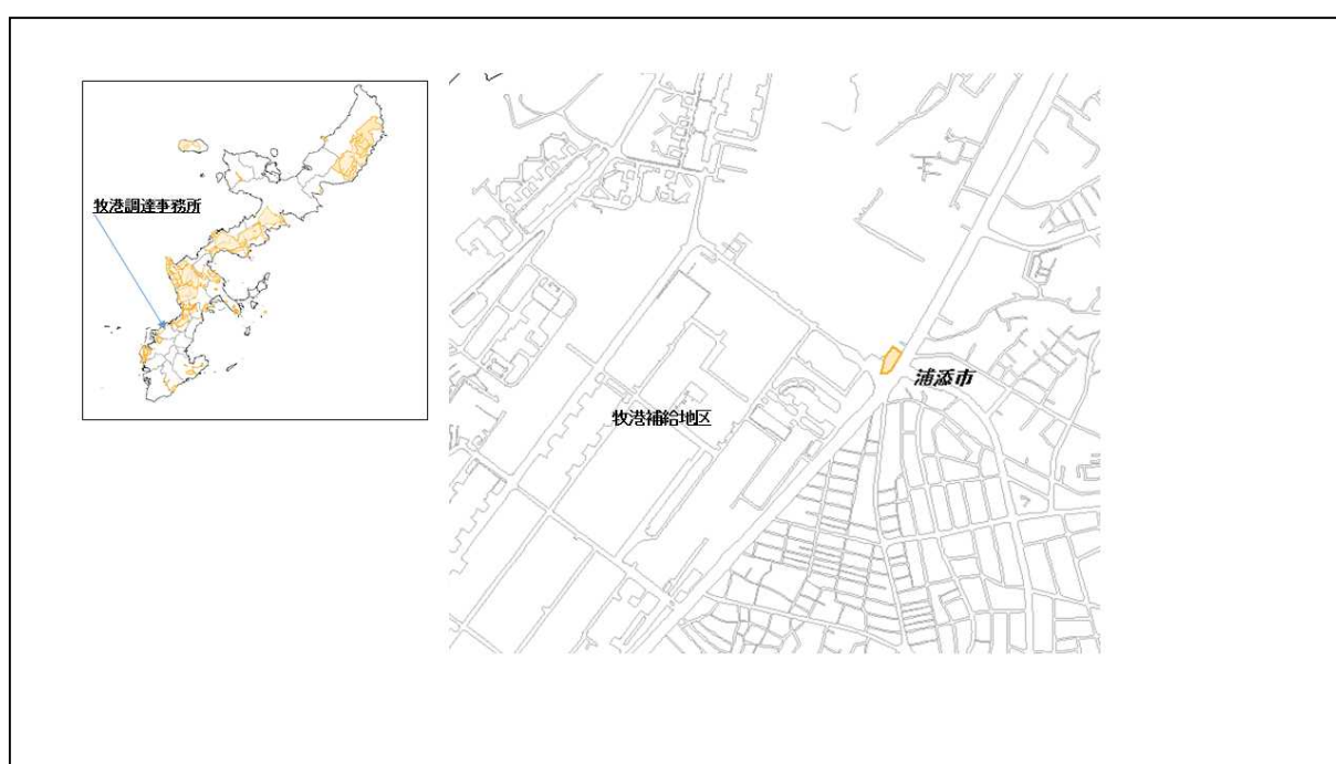
図 56-1 牧港調達事務所の位置図（昭和47年時）

( http://www.mofa.go.jp/mofaj/area/usa/sfa/kyoutei/pdfs/02_03.pdf ) を参照