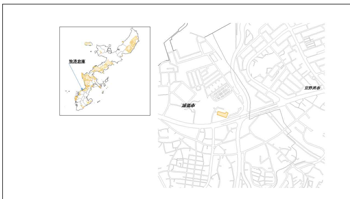
図 52-1 牧港倉庫の位置図（昭和47年時）

( http://www.mofa.go.jp/mofaj/area/usa/sfa/kyoutei/pdfs/02_03.pdf ) を参照