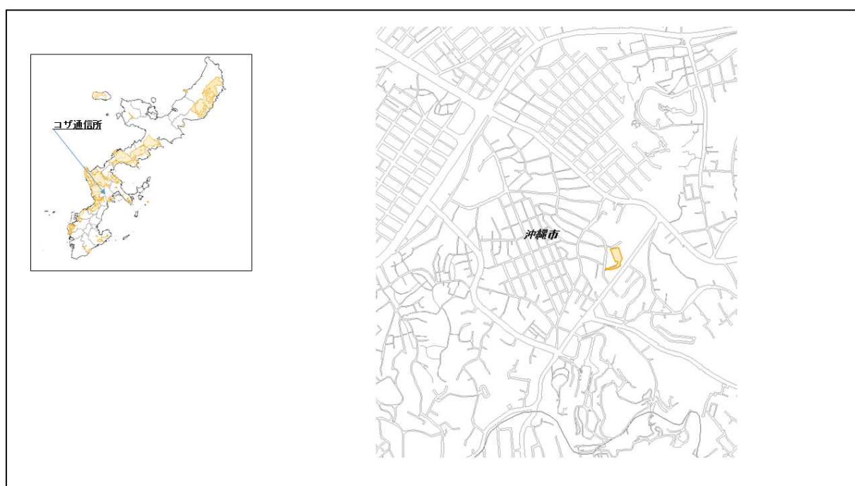
図 40-1 コザ通信所の位置図（昭和47年）

( http://www.mofa.go.jp/mofaj/area/usa/sfa/kyoutei/pdfs/02_03.pdf ) を参照