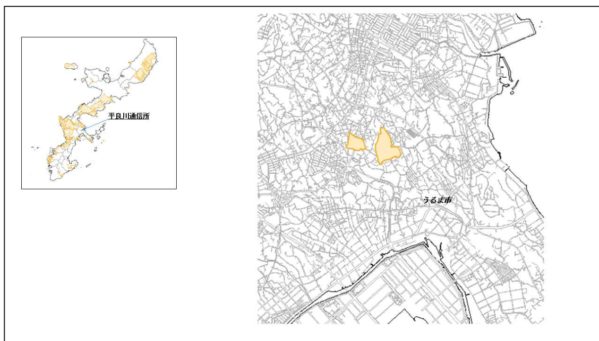
図 32-1 平良川通信所の位置図（昭和47年時）

( http://www.mofa.go.jp/mofaj/area/usa/sfa/kyoutei/pdfs/02_03.pdf ) を参照