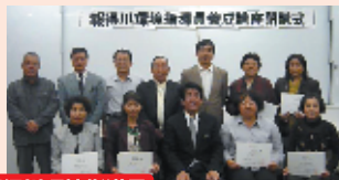
報得川環境指導員

生活排水を適切に処理するために「生活の中で私たちは何をしたらいいのか」を指導するガイドを養成する取り組みです。 糸満女性連合会では、会員26名が認定されました。