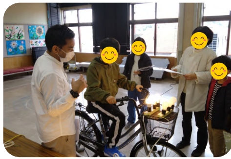
自転車発電機を使って白熱電球とLEDの差を体感