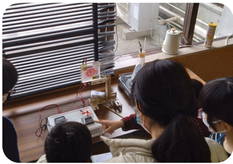
火力発電の仕組みを模型を使って学習

参加者からは「発電の仕組みを知ることができてよかった。」、「省エネ家電を買うメリットが理解できた」、「これからも開催して欲しい」のような声が聞かれ、非常に好評でした。