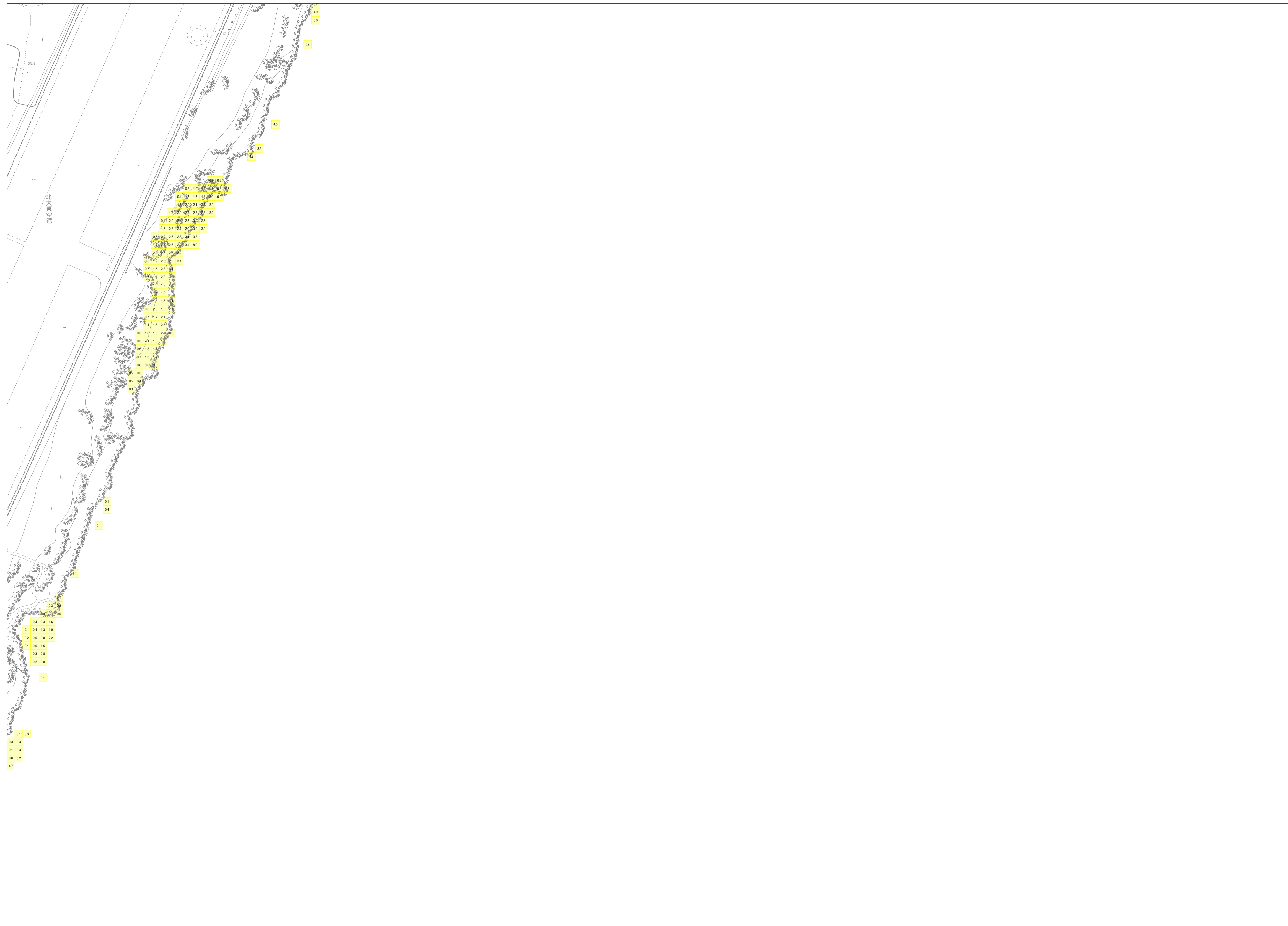
この地図は、沖縄県数値地形図を使用したものである。(平28企情第334号)