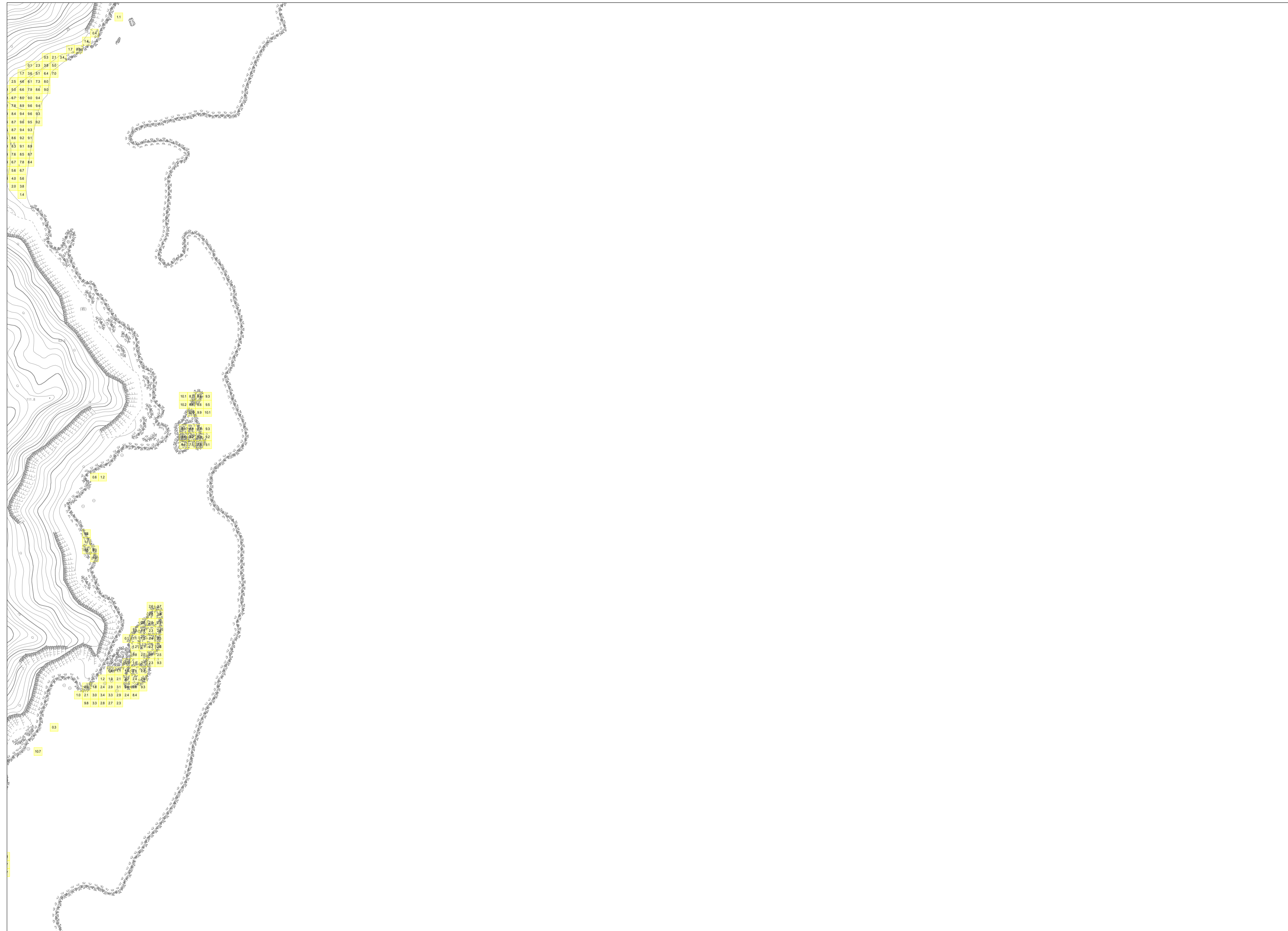
この地図は、沖縄県数値地形図を使用したものである。(平28企情第334号)