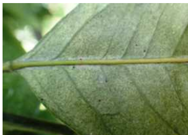
ハダニの寄生による葉のかすれ症状