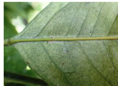
ハダニの寄生による葉のかすれ症状